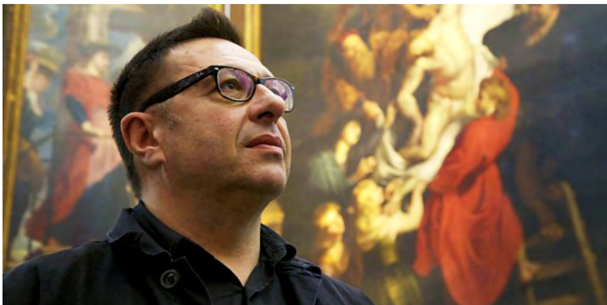
Catherine LEBRUN pour Rubens , de Waldemar Januszczak (ZCZ Films), diffusé sur Histoire (laboratoire Vidéo Adapt)